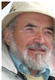
Article © Gerhard Stilz 1994/2016

Schleife zurück zum Informationszentrum. Ich ziehe es vor, trotz der großen, großen Hitze umzudrehen und wieder zum Fluss abzustiegen. Die Romantik von Fels, Höhe, Steig und Fluss, der Ausblick über das Siebzehnmeital, an dessen Ende wieder Wasserläufe und lebensspendende Idyllen in der Wüste zu erwarten sind, fasziniert mich. Aber ist es nur die Romantik des Europäers? Haben nicht auch die australischen Aborigines wohlweislich in dieser Umgebung ihre Wohnplätze angelegt und ihre Heiligtümer gesucht, gefunden und verteidigt? Ist unsere Vorstellung vom Romantisch-Pittoresken doch demjenigen Paradies näher, in welchem das gute Leben, das ursprüngliche Leben und das Über-Leben aller Menschen verlässlicher ermöglicht wird? Die anthropologische Allgemeingültigkeit des materiellen Klischees der Idylle wäre zu überprüfen. Es als imaginäre Konvention zu dekonstruieren, geht an der Lebenspraxis vorbei. Ich schwimme mich in der "safe swimming area" frei von Kopfschmerzen. Welche Fische unter mir schwimmen, lerne ich anschließend bei der Ranger Station. Dort muss ich mich auch noch von meiner Wanderung zurückmelden. "Howja goin?" fragt der Ranger als "mate". "Hot enough", sage ich, nach den Regeln des Outback.