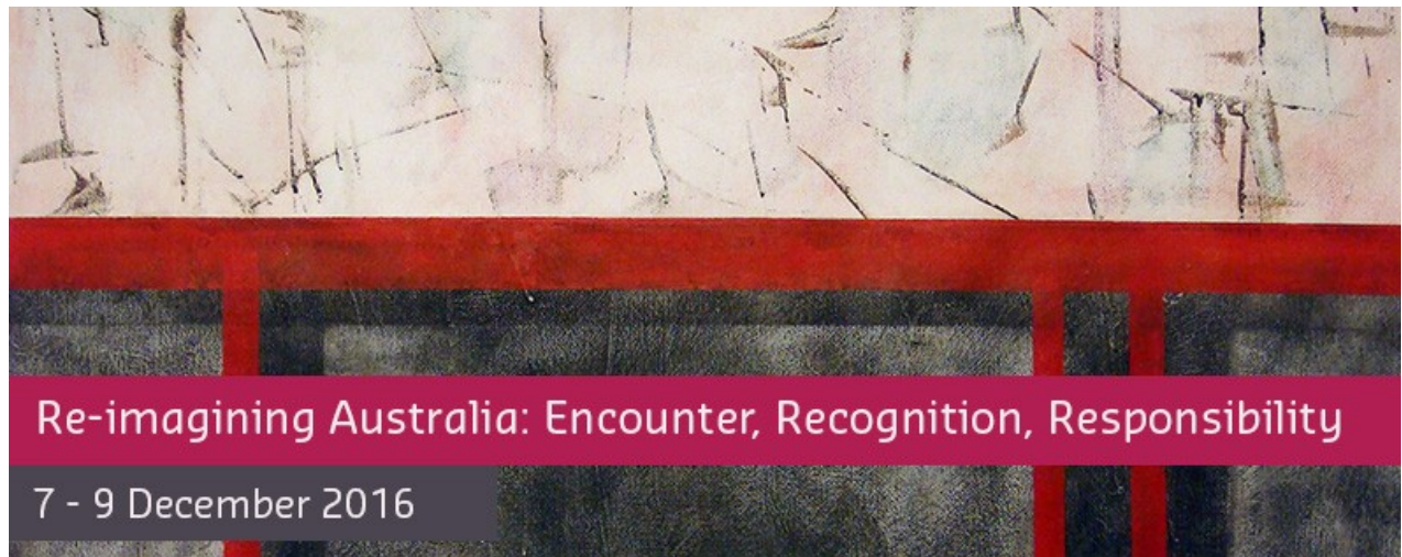
Banner image by John Teschendorff. Title: From the New World Drawing XXXIV Adagio (Dawn) 2008. Private Collection Perth, WA.

Centre for Human Rights Education, Australia-Asia-Pacific Institute, the School of Media, Culture and Creative Arts, Curtin University